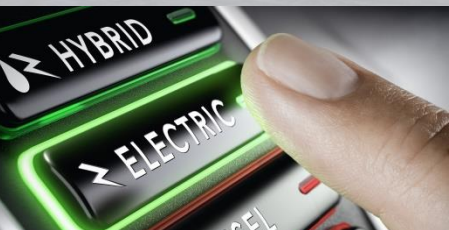
混合電動運輸工具